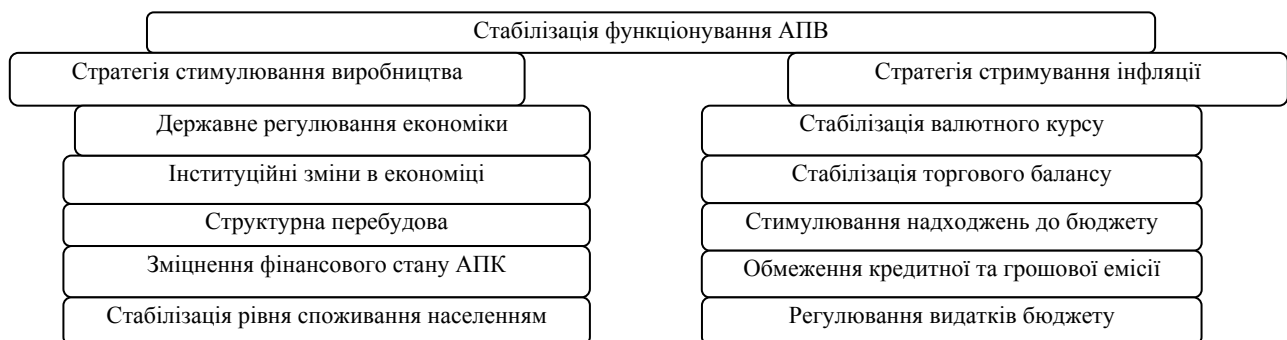
Рис. 3. Основні напрями стабілізації агропромислового виробництва

Методологічно важливим у процесі обґрунтування перспективних напрямів розвитку АПВ є виділення стратегій, які пов’язані з розвитком комплексу, функціонуванням на ринках, поведінкою в конкурентному середовищі. Вважаємо суттєвими ознаками класифікації стратегій: напрям розвитку та зростання, позицію кожної галузі, стан функціональних сфер діяльності, модель поведінки й досягнення конкурентних переваг.